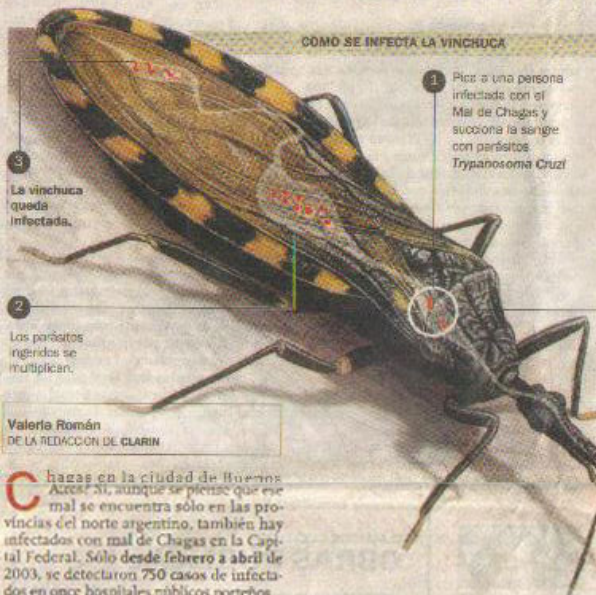
COMO SE INFECTA LA VINCHUCA

► Fue entre febrero y abril de este año y a través de análisis de pacientes en once hospitales públicos porteños. Casi todos se infectaron en sus provincias de origen o en países limítrofes.